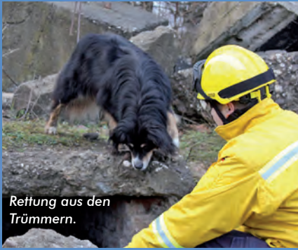
Rettung aus den Trümmern.